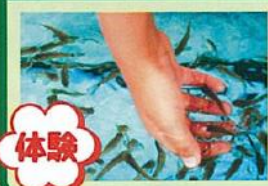
ドクターフィッシュ