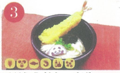
3 天ぷらうどん・そば ¥900