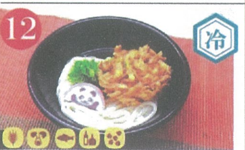
12 冷やし野菜かきあげうどん・そば ¥840