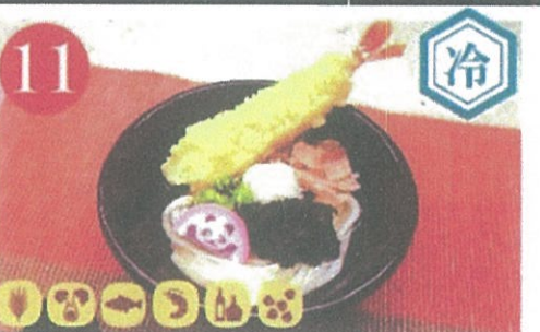
11 冷やし天ぷらうどん・そば ¥900