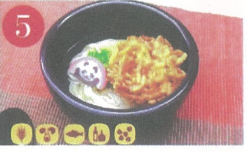
5 野菜かきあげうどん・そば ¥840