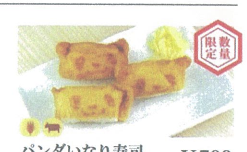
パンダいなり寿司 (3個入り) ¥500