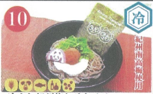
10 冷やし紀州梅しそとろろうどん・そば ¥840