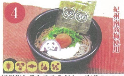
4 紀州梅しそとろろうどん・そば ¥840