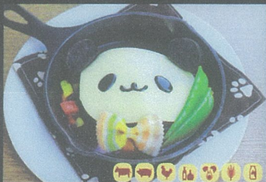
煮込みパンダハンバーグ Stewed Hamburger Steak with Rice ¥1,820