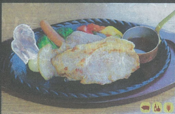
イブ美豚のポークソテー Sautéed Pork of Ibu Pork with Rice ¥1,890