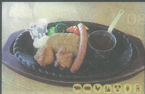
Safari グリル Safari Grill with Rice ¥1,890