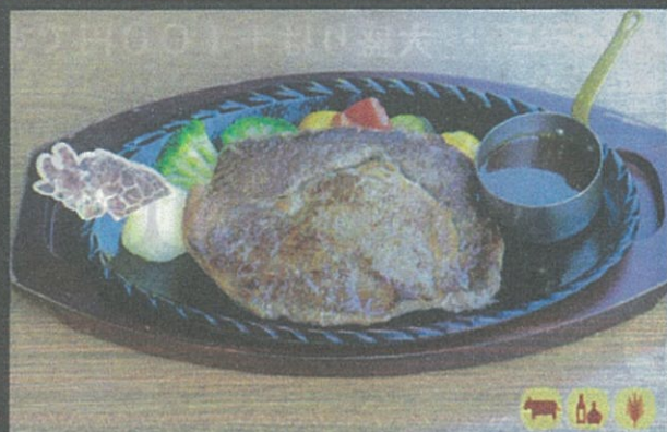
Jambo ステーキ リブローズ Rib with Rice ¥2,790