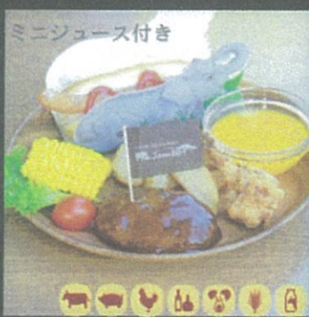
Jambo プレート Jambo Plate with mini juice ¥1,580