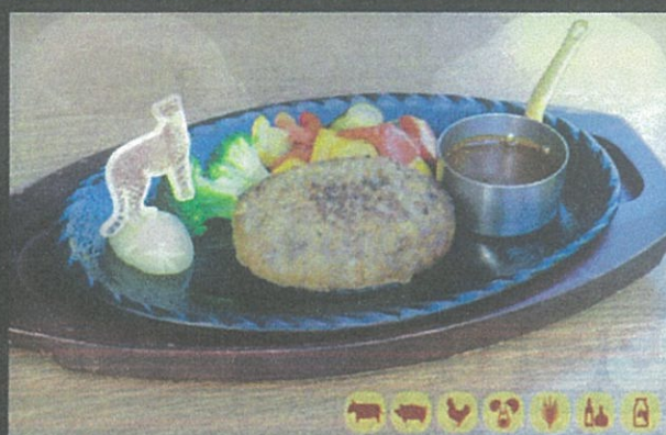
ハンバーグステーキ Hamburger Steak with Rice ¥1,890