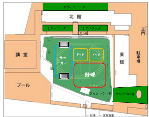
ほうかご あそ 放課後の遊びかた