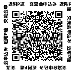
申込み QR コード